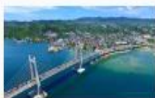
Jembatan Merah Putih