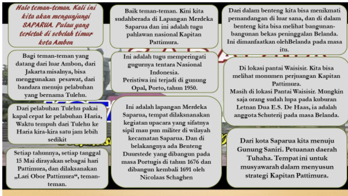
Video, Youtube: SAPARUA, destinasi sejarah