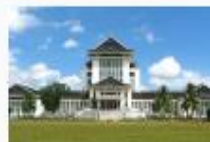
Jembatan Merah Putih